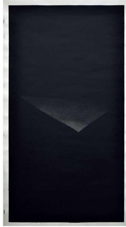
Orhan Yıldız'ın sergide yer alan koyu renkli eseri.

Sokağa açılan geniş vitriniyle mekândan bir görüntü.